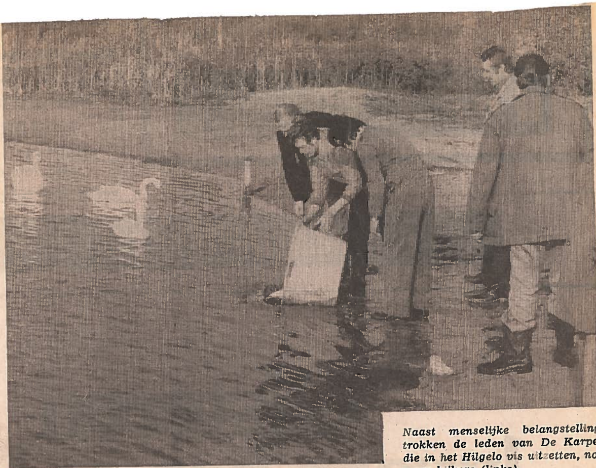
Naast menselijke belangstelling, trokken de leden van De Karper die in het Hilgelo vis uitzetten, nog meer kijkers (links).