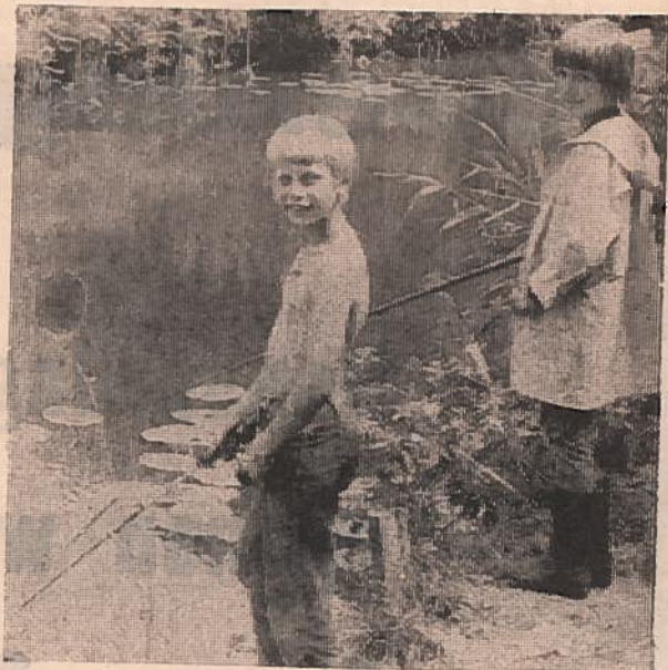
Ook de jeugd heeft de hengelsport ontdekt.

Is vissen een dure sport? Het antwoord kan kort zijn: neen. Een visser moet lid zijn van een vereniging of moet een dagkaart kopen. In beide gevallen zijn de bedragen te verwaarlozen. Ook de aanschaf van het materiaal dat een visser nodig heeft, vergt geen grote investering. En de steeds terugkerende kosten zijn helemaal klein. Wie geen wormen wil steken, kan ze kopen voor een laag bedrag. En tenslotte kun je altijd nog met brood vissen. Daar hoeft de visser zelf geen stukje brood minder om te eten.