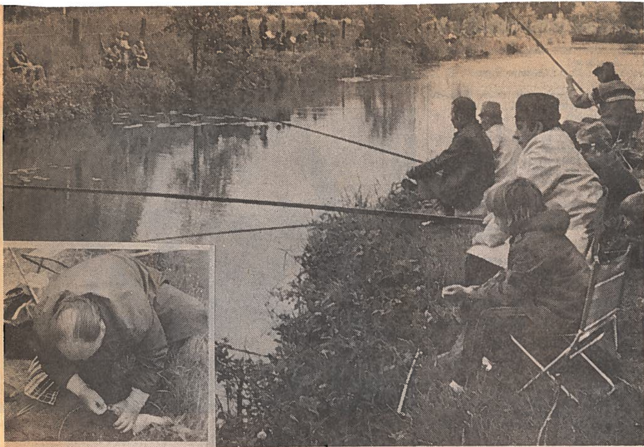
Druk was het zaterdag bij de Puls tijdens de hengelwed strijd van De Karper. Inzet: een van de karpers wordt van de haak gehaald.