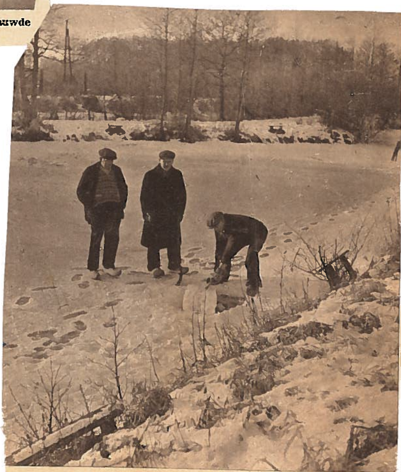
In het ijs van De Puls wordt een wak gehakt, opdat de visschen leven... om straks rond 's hengelaars simmetje te zwemmen,