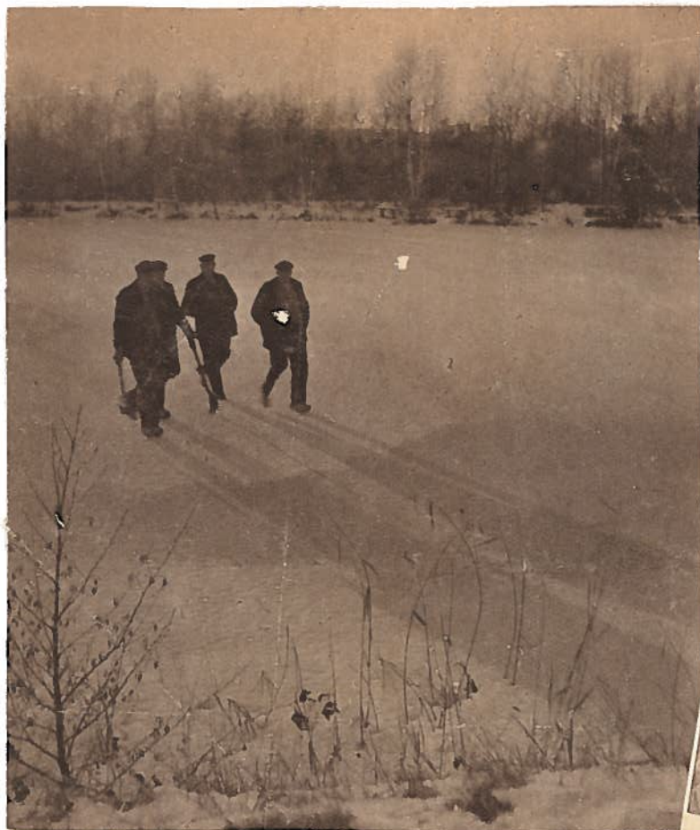
Op het ijs mag er vreugde zijn, er onder is het een benauwde geschiedenis. Maar de verlossers zijn nabij....