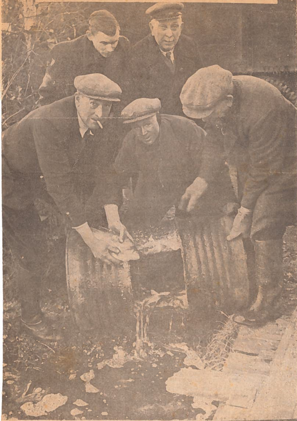
De visch wordt in vrijheid gesteld.

— Onder onze voetstappen knarste het bevroren gras, een ijzige Oostenwind blies ons om de ooren, Zaterdagmiddag op weg naar het Winterswijksche vischwater de Puls. Het leek er een soort overwintering op Nova Zembla. De sterkste kerel kliefte met een bijl de ruige boomwortels, alleén buiten in de koude. Vijf, zes anderen verdeelden in het houten keetje hun aandacht tusschen den zwoeger buiten en den hoogen ouderwetschen kachel in den hoek, die rookte en een eerlijke poging deed wat warmte te geven.