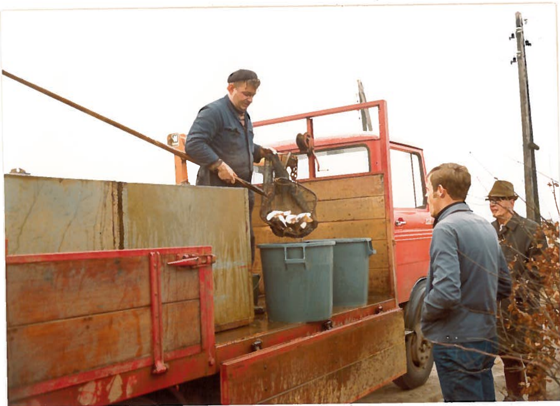
Bones and good land was caught for old Ben in de Pals med de Onde Kerkhof & Hilpele