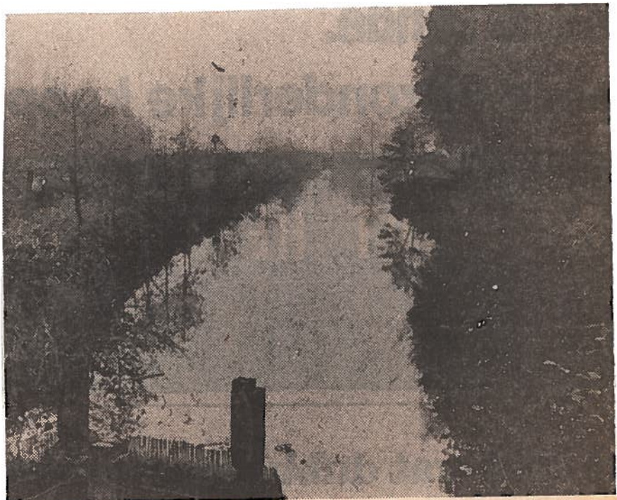
Het viswater de Puls.