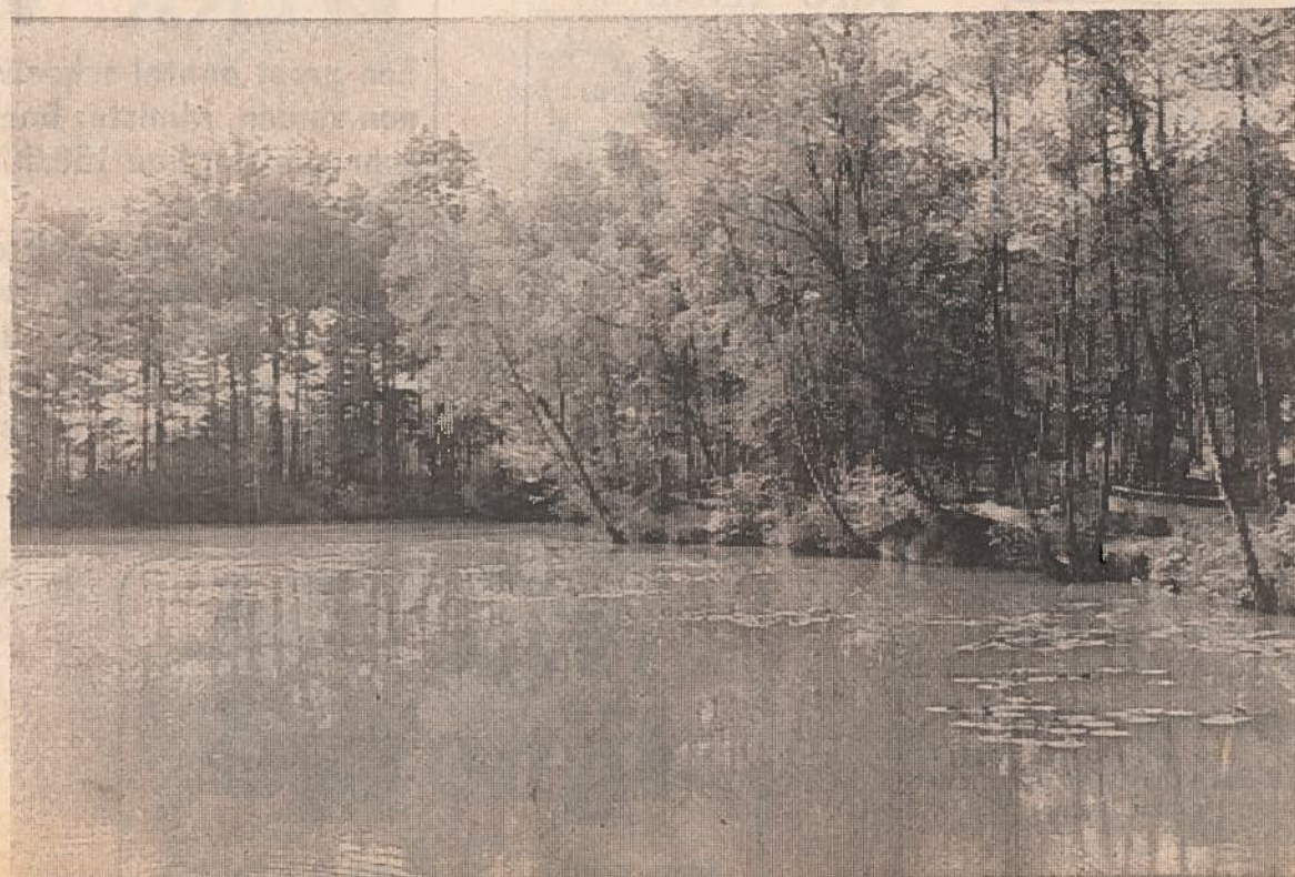
Het Grote Gebeuren

Een van de Italiaanse Meren, het visdomein van Het Voorntje.